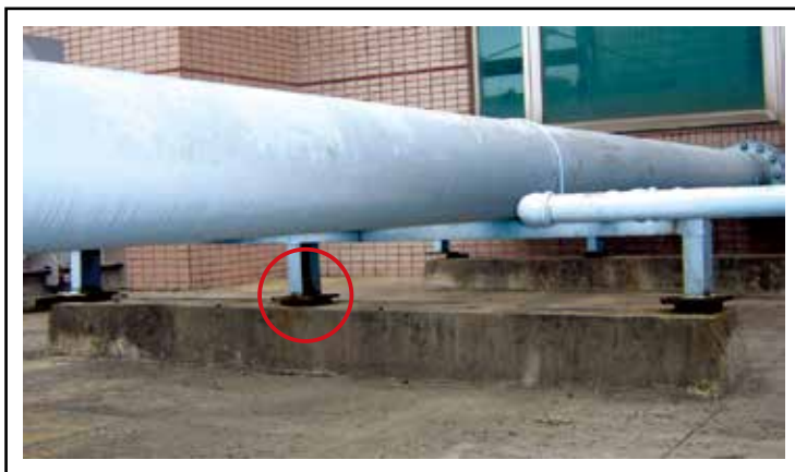
水平管安裝YS-P橡膠墊片