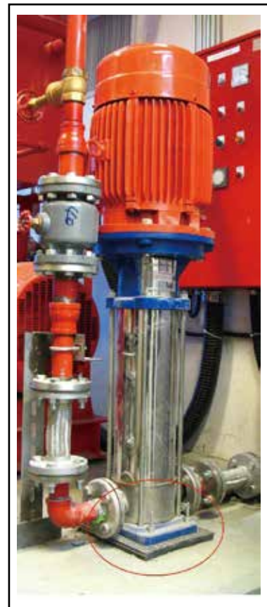
立式水泵安裝YS-P橡膠墊片